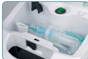
accessoires intern opgeborgen