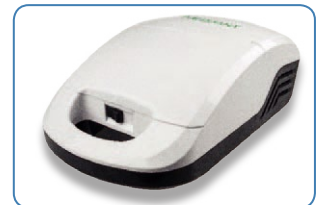
compact en mobiel