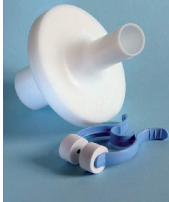
Filter kit MG IIC (MicroGard IIC + disposable rubber mondstuk + neusklem)