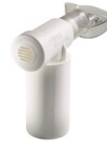
POWERbreathe Medic € 39,95