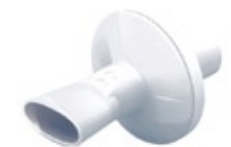
Filter € 41,32 per 50 stuks (excl. BTW)