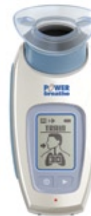
KH2: Digitale POWERbreathe met BreatheLink software € 1.399,- (excl. BTW)