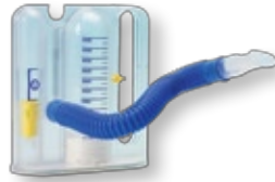
Respiflo 5000 Volumetrainer