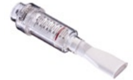
Threshold IMT € 29,65