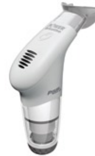
POWERbreathe Medic Plus € 59,95

Prijzen kunnen wijzigen, check onze website voor actuele prijzen.