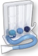
Respiron Triball Flowtrainer