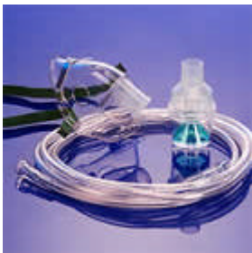
Medix vernevelset met masker kind of volwassen