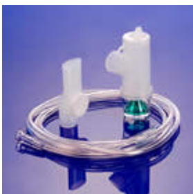
Medix ultraset met kleppen

De Ultraset vernevelaar is voorzien van een revolutionair kleppensysteem, dat zorgt voor een zeer hoge concentratie aan medicamenten per inademing (maximale output met een correcte MMAD waarde). Doordat de Ultraset voorzien is van een éénrichtingskleppensysteem wordt een minimum aan residu bereikt. De vernevelaar is bovendien geruisarm.