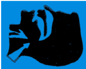
position incorrecte fig A